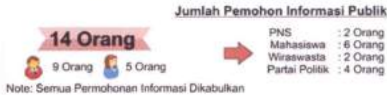
Gambar 1 Rincian Jumlah Pemohon Informasi Publik

Berdasarkan jenis kelamin, jumlah pemohon informasi berjenis kelamin laki-laki berjumlah 9 (sembilan) orang, dan jenis kelamin perempuan berjumlah 5 (lima) orang. Sedangkan berdasarkan pekerjaan mahasiswa berjumlah 6 (enam) orang, PNS 2 (dua) orang, Wiraswasta 2 (dua) orang, Partai Politik 4 (Empat orang). Sebagian besar pemohon informasi meminta hasil pileg dan pilwalkot Kota Serang. 12 orang pemohon langsung mengajukan permohonan ke PPID KPU Kota Serang, Sedangkan 2 (dua) orang pemohon, melakukan permohonan informasi melalui e-PPID.