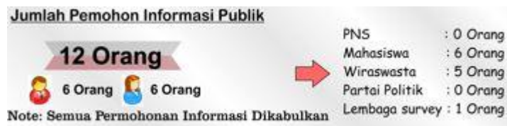
Gambar 1 Rincian Jumlah Pemohon Informasi Publik

Berdasarkan jenis kelamin, jumlah pemohon informasi berjenis kelamin laki-laki berjumlah 6 (enam) orang, dan jenis kelamin perempuan berjumlah 6 (enam) orang. Sedangkan berdasarkan pekerjaan mahasiswa berjumlah 6 (enam) orang, Wiraswasta 5 (lima) orang, lembaga Survey 1 (satu) orang. Sebagian besar pemohon informasi meminta hasil pileg dan pilwalkot Kota Serang. 11 orang pemohon langsung mengajukan permohonan ke PPID KPU Kota Serang, Sedangkan 1 (satu) orang pemohon, melakukan permohonan informasi melalui e-PPID.